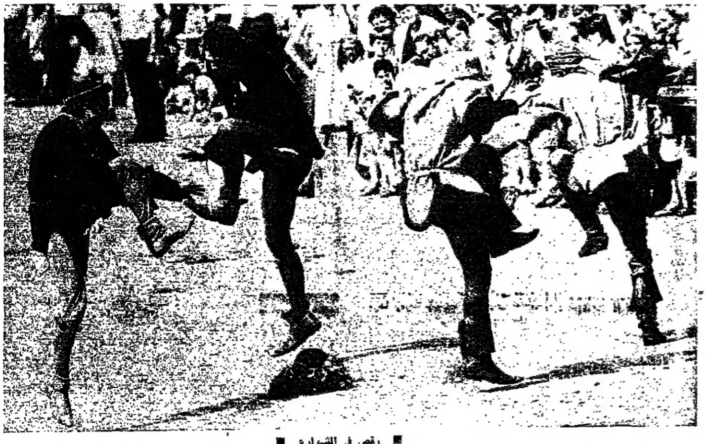
رقص في الشوارع

احبت مقاطعة لانكشا في الميا الغربية الفكرى الـ ٥٠٠ زوج نجل دوق امارة لانكشا على الاميرة الراقصة الجمال جودينا ابنة ملك كورسي في بولونيا سنة ١٢٧٥ . وحظي تلك الزواج بلكر الاحتفالات في العالم ، حيث استمر ثمانية ايام ، واشترك فيه ١١٠٠ عازف وعازنة عزفوا في جميع شوارع امارة لانكشا الى ايام المدون والحجوات اللبناجوا من مختلف البلدان الاوروبية . وجذب المقاطعات الالمانية . وقد استهلك المدعون خلال هذه الاحتفالات ٢٢ بقره ، و٧ الاف كيلو غرام ، و٦١٠ راس ماعز ، و١١٠٠ راس غنم ، و٦٢ الف كرواج . واليوم اعادت المقاطعة الالمانية احتفال تكريما لزوج في العالم وسط بهجة الالوف الذين شاركوا في احياء تكريما لزوج امير مقاطعتهم .